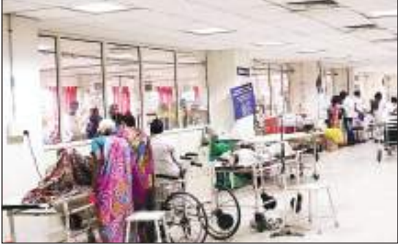
दिल्ली में आवारा कुत्तों का आतंक

टीएम एक्शन इंडिया/नई दिल्ली/दीपचंद्र काण्डपाल दिल्ली की स्वास्थ्य सुविधाओं को बेहतर बनाने के लिए छोटे अस्पतालों को ठीक किया जाएगा। इनमें पर्याप्त डॉक्टर नहीं होने से मरीजों का बोझ बड़े अस्पतालों पर पड़ रहा है। इससे बड़े अस्पतालों की व्यवस्था भी चरमरा जाती है। वहीं, मरीजों को भी इलाज के लिए लंबा इंतजार करना पड़ा है। अस्पतालों की व्यवस्था को देखते हुए दिल्ली के एलजी वीके सक्सेना ने समीक्षा बैठक में विभाग को डॉक्टरों और कर्मियों के खाली पदों को तत्काल स्थायी तौर पर भरने का आदेश दिया है। वर्तमान में दिल्ली सरकार के 30 अस्पताल हैं। इसके अलावा सोसाइटी के सहयोग से सरकार आठ अन्य अस्पताल का संचालन कर रही है। इनमें से जीबी पंत, गुरु नानक आर्इ केयर सेंटर, दिल्ली स्टेट कैन्सर इंस्टीट्यूट, चौधरी ब्रह्म प्रकाश आयुर्वेद चिकित्सालय, जनकपुरी सुपर स्पेशियलिटी अस्पताल, मौलाना आजाद इंस्टीट्यूट ऑफ डेंटल साइंसेज स्पेशलिस्ट सेवाएं देते हैं। जबकि लोक नायक, जीटीबी, डीडीयू सहित कुछ अस्पताल बड़े स्तर पर सामान्य सेवाएं दे रहे हैं। यह सेवाएं बाहरी दिल्ली व दूरदराज क्षेत्र में चल रहे