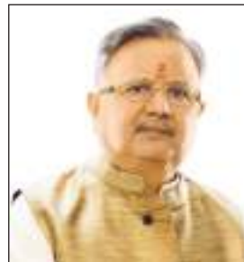
डॉ. रमन सिंह पूर्व मुख्यमंत्री (छ. ग. शासन), राष्ट्रीय उपाध्यक्ष (भाजपा)

आज भारत विश्व में अपनी अलग पहचान रखता है, दुनिया के बड़े-बड़े राष्ट्रपक्ष्य माननीय प्रधानमंत्री नरेंद्र मोदी जी का सम्मान करते हैं और भारत में उम्मीद की एक नई किरण देखते हैं। हालही में दिल्ली में जी20 के आयोजन में दुनिया भर से आए राष्ट्रपक्ष्य माननीय प्रधानमंत्री नरेंद्र मोदी जी की प्रशंसा की, भारत आज विश्वगुरु बनने की ओर अग्रसर है इसका श्रेय शुरू हुआ जब चेन्नई में तमिलनाडु प्रगतिशील लेखक और कलाकार संघ के कार्यक्रम में उदयनिधि स्टालिन ने कहा था कि कुछ चीजों का विरोध नहीं किया जा सकता, उनका खात्मा किया जाना चाहिए। मच्छर, डेंगू बुखार, मलेरिया और कोरोना का विरोध नहीं किया जा सकता।