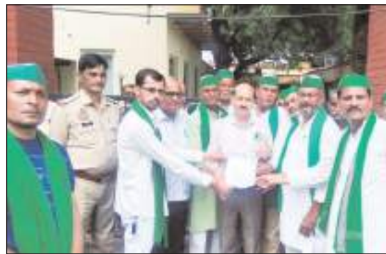
किया। विभागीय अधिकारियों ने इसकी सूचना पुलिस को दे दी। मौके पर स्थानीय थाने का पुलिस फोर्स भी पहुंच गया। इसके बाद संगठन के पदाधिकारियों ने कार्यालय के गेट पर अपनी मांगों को पूरा किए जाने संबंध ज्ञापन सौंपा। आगरा उत्तरी बाईपास सराय मगना बलदेव मथुरा पर किसान

मथुरा/टीम एक्शन इंडिया उत्तरी बाईपास कट को लेकर करीब एक महीने से चल रहा किसानों का आंदोलन गांव से शहर तक पहुंच गया। बलदेव क्षेत्र के गांव सराय मगना के पास चल रहे आंदोलन के समर्थन में शनिवार को जिला मुख्यालय पर किसान संगठन के कार्यकर्ताओं ने ज्ञापन सौंप कर अपने साथियों का समर्थन किया और समस्या के समाधान की मांग की। भारतीय किसान यूनियन टिकैत के कार्यकर्ताओं ने महानगर के कृष्णापुरी स्थित लोग निर्माण विभाग के कार्यालय के गेट पर प्रदर्शन